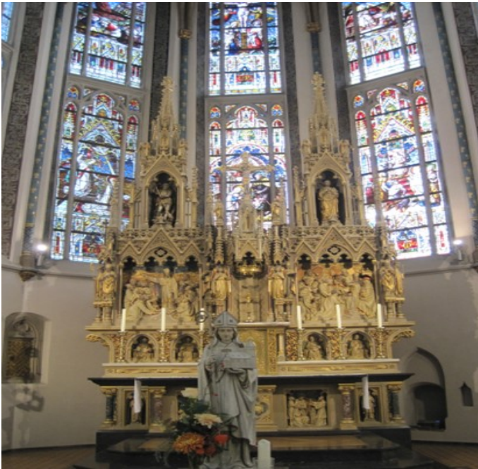
Willibrordus Kerk Deurne