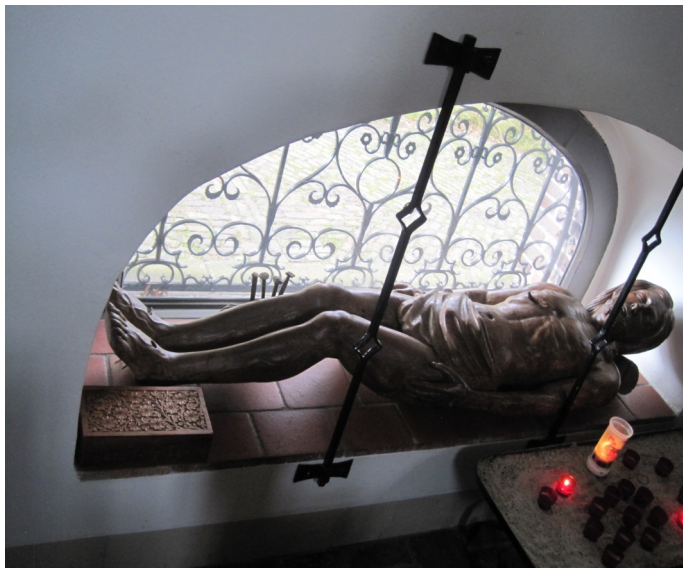
Spijker Kapel in Esdonk